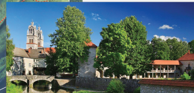
Ribnica, grad, Plečnikovi zvoniki