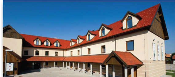
IZHODIŠČE - krajša pot, Rokodelski center Ribnica