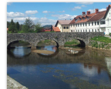
Francoski kamniti most